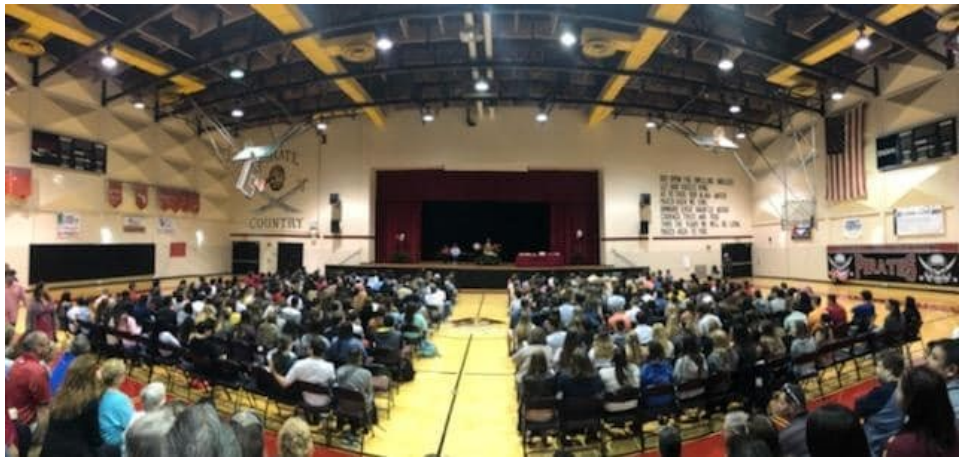
Participe y manténgase involucrado Casa llena en una asamblea de padres (foto tomada en agosto de 2019)