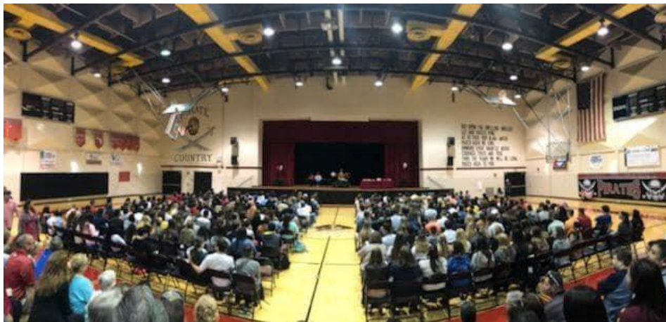
Participe y manténgase involucrado Casa llena en una asamblea de padres (foto tomada en agosto de 2019)

6. Brindar asistencia, capacitación, talleres, eventos y / o reuniones. para que los padres los ayuden a comprender el sistema educativo, el plan de estudios, los estándares, las evaluaciones estatales y los niveles de rendimiento.